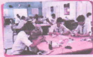
અદલ રીકરીંગ પ્રયોગ શાળા જ.ન.વિ. અદિલાબાદ (નિવગણા)

જવાહર નવોદય વિદ્યાલય પસંદગી પરીક્ષા દ્વારા જવાહર નવોદય વિદ્યાલયમાં ૨૦૧૯-૨૦ દરમ્યાન ધોરણ-૬ માં પ્રવેશ માટે ઓનલાઈન અરજીઓ આમંત્રિત કરવામાં આવે છે.