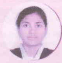
અનુષ્ઠાફેરે જ.ન.વિ. વરુડ