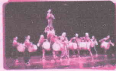
જ.ન.વિ. મોડયા (કર્ણાટક)ના વિદ્યાર્થીઓ દ્વારા 'કોલ્ડુ કુનીતા' કથા પ્રદર્શન