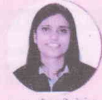
કન્યાકુમારી જ.ન.વિ. કોલકાત NEET 2018 માં ટોપર

આંતરરાષ્ટ્રીય પ્રવેશ - ૨૦૧૮ માટે પસંદગી પામેલ વિદ્યાર્થીનીઓ