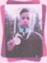
નિરુપમાર જ.ન.વિ. કનૈયા (કર્ણાટક) SGFI (Boxing) માં સોલ્ડ મેડલ ૧૮-૩૦ ડિસેમ્બર ૨૦૧૭